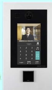
タッチパネル式カメラ付集合玄関機