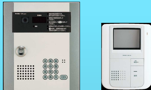
GAX白黒モニターシステム (2001~2007年)