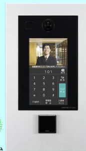
タッチパネル式カメラ付集合玄関機