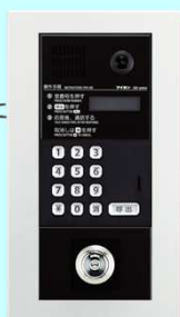
カメラ付集合玄関機